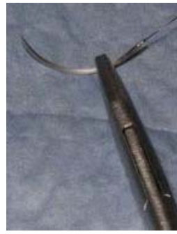
C: Montez l'aiguille selon la manière habituelle pour que la pointe fasse face à votre gauche.