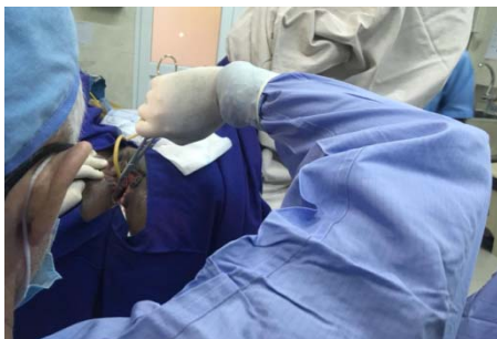
E: Pour toutes les deux prises, maintenez votre coude droit en haut et en dehors alors que vous tenez le porte-aiguille comme un bic.