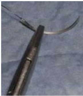
A: Montez l'aiguille pour que la pointe fasse face à votre droite (alors que vous la tenez en mi-prône)

Prise en avant droit: si vous voulez suturer en allant de la droite de la patiente à sa gauche. Cette prise est utilisée au côté droit. (voir Figure C et D)