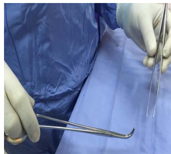
F: Montre la pince à angle droit (Mixter) tenu dans la main droite et la pince à disséquer dans la gauche.