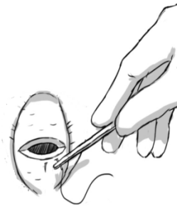
B: Montre l'usage de la prise de revers. Le porte-aiguille est tenu comme un bic.